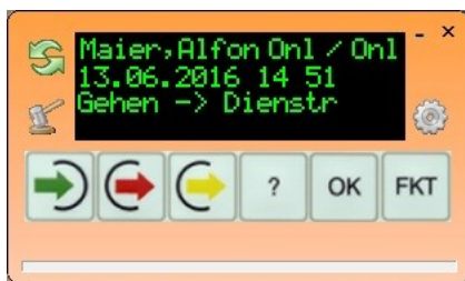
Virtuelles Terminal Buchungserfassung am PC-Arbeitsplatz