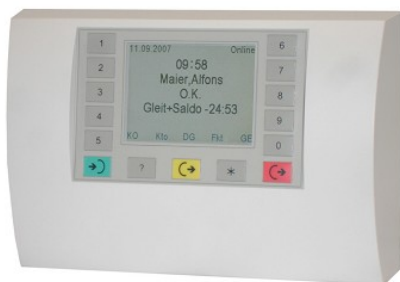
Terminal T600 für Personal- und Auftragszeiterfassung mit berührungslosem Transponderleser

Die Buchungserfassung erfolgt über Hardwareterminals mit berührungslosem Transponderleser oder über ein Virtuelles Terminal am PC-Arbeitsplatz.